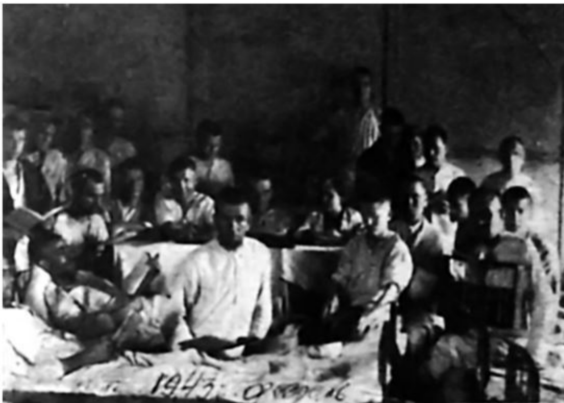
Курсы бухгалтеров в Казанском госпитале, 1943 год

Все хорошо, никаких претензий. Хоть и война, тем не менее, порядок был полный. И лечили, и кормили, и условия – все нормально. Госпиталь располагался в здании какого-то театра. И территория при нем хорошая, можно было и погулять и подышать. Поэтому мы и в город почти не ходили. А всего в госпитале лечилось больше тысячи человек, девять или десять отделений. Начальником был татарин лет за шестьдесят, так я бывало, по своей комсомольской работе к нему запросто заходил.